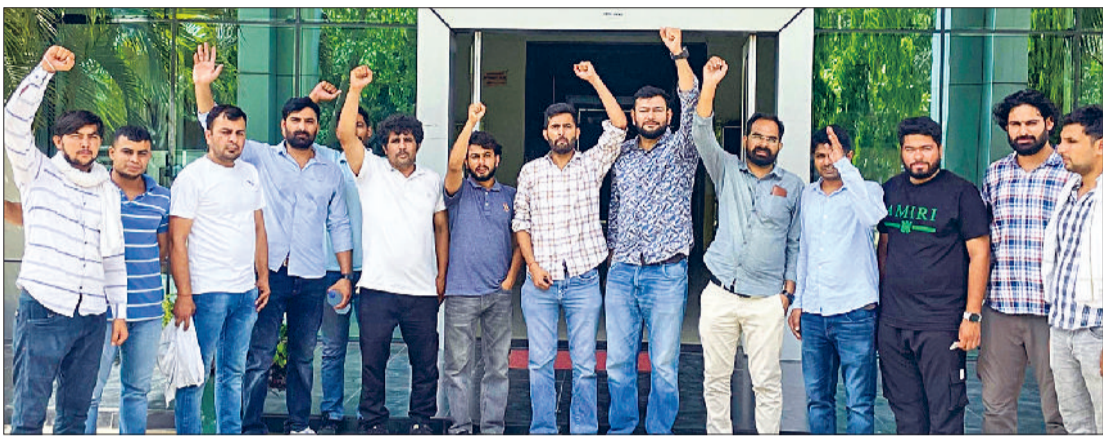
रोहतक। विरोध प्रदर्शन करते संयुक्त छात्र संघर्ष समिति के सदस्य।

ने कहा कि विवरार को यूनिवर्सिटी ने बताया कि उन्होंने 5 गुना फीस पर रोक लगा दी है। लेकिन बिना फीस जाने विद्यार्थी प्रवेश परीक्षा कैसे दे सकते हैं। भारत में ऐसा कौन सा शिक्षण संस्थान है जिसमें विद्यार्थी को दाखिला लेने से पहले उसकी फीस ही नहीं पता।