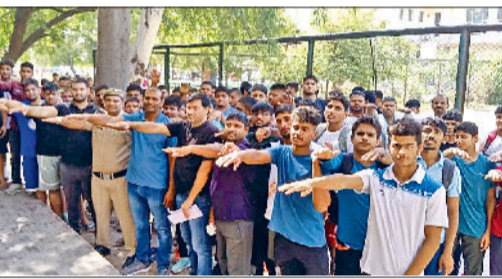
रोहतक। नशे के खिलाफ जागरूकता कार्यक्रम में शपथ लेते खिलाड़ी।